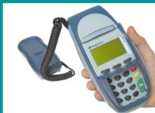
Hand Over Konzept für unkomplizierte PIN-Eingabe

Drahtlose Technologien wie WLAN und GPRS werden zukünftig auch im Countertop-Bereich eine Rolle spielen und sind durch das Plug>IT Konzept realisierbar.