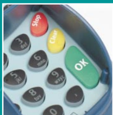
Tastatur mit ergonomischem Sichtschutz und taktilen Symbolen