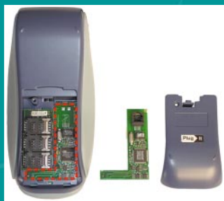
Plug>IT Steckplatz für flexible Kommunikation