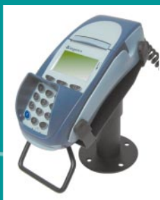
Dreh- und schwenkbare Terminalhalterung (Option)