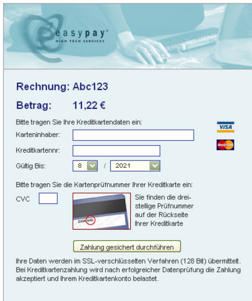
Grafik 2: Autorisierung Kreditkarten