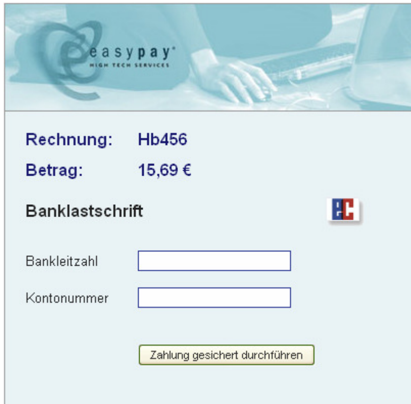
Grafik 4: Transaktionsansicht